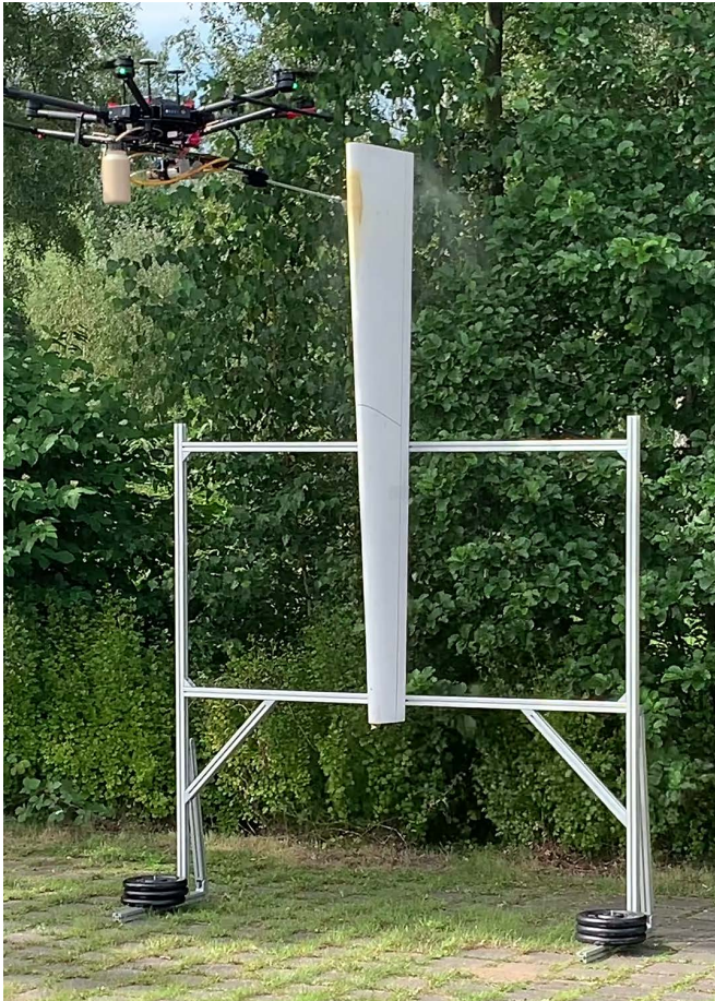
Abb. 1 Lackierdrohne im Sprühversuch: Beschichtungsmaterial wird von der Lackierdrohne über eine Lanze appliziert.